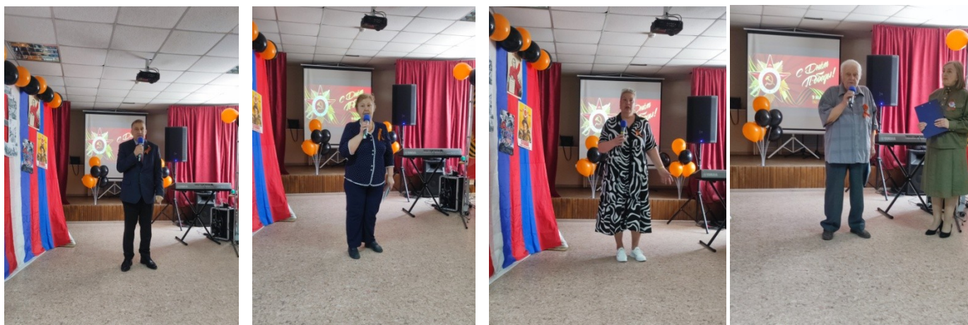
Песни военных лет, чтение стихов завораживали зрителей, будто перенося их в то страшное, но значимое в истории время. Концерт прошел на высшем уровне.