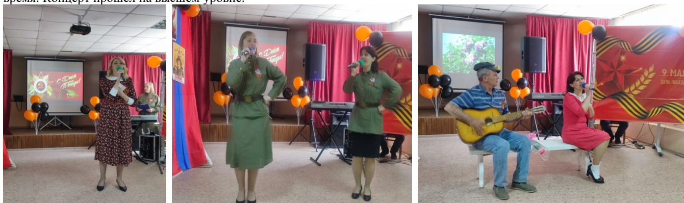
Память о подвигах героев навсегда останется в наших сердцах и будет передаваться из поколения в поколение. Сегодня наследники Великой Победы достойно выполняют свой воинский долг, участвуя в специальной военной операции, продолжая славное дело своих предков. Низкий поклон и благодарность всем нашим защитникам!