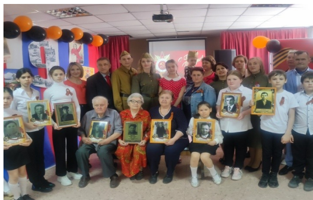
Праздник "со слезами на глазах" оставил глубокое впечатление в сердце!