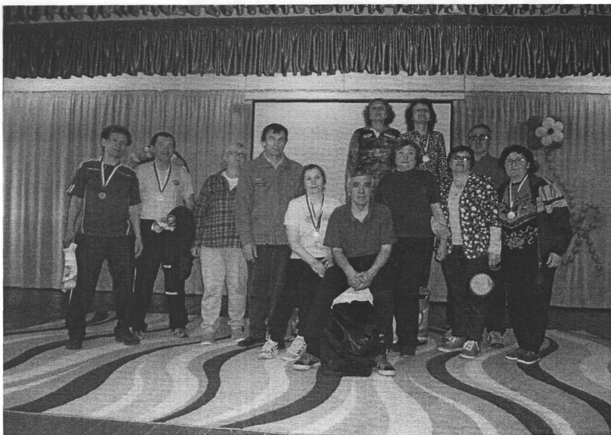
Ура!!! нашим спортсменам и победителям!!!

09 мая в р.п. Линево впервые прошел турнир по волейболу среди смешанных команд в формате «микст 4+2», посвященный 74-ой годовщине победы в Великой Отечественной войне на призы администрации Искитимского района.