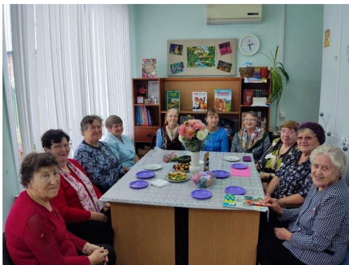
Волонтерская группа «Лебедевские девочки с плюсом» поздравила своих помощников-волонтеров с Днём защитника Отечества

В феврале ветеранский клуб общения «Веста» провел заседание на тему: «Олег Басилашвили – известный актер и писатель».